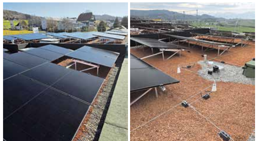
Auf diesem Dach wird künftig Solarstrom für die Region produziert.