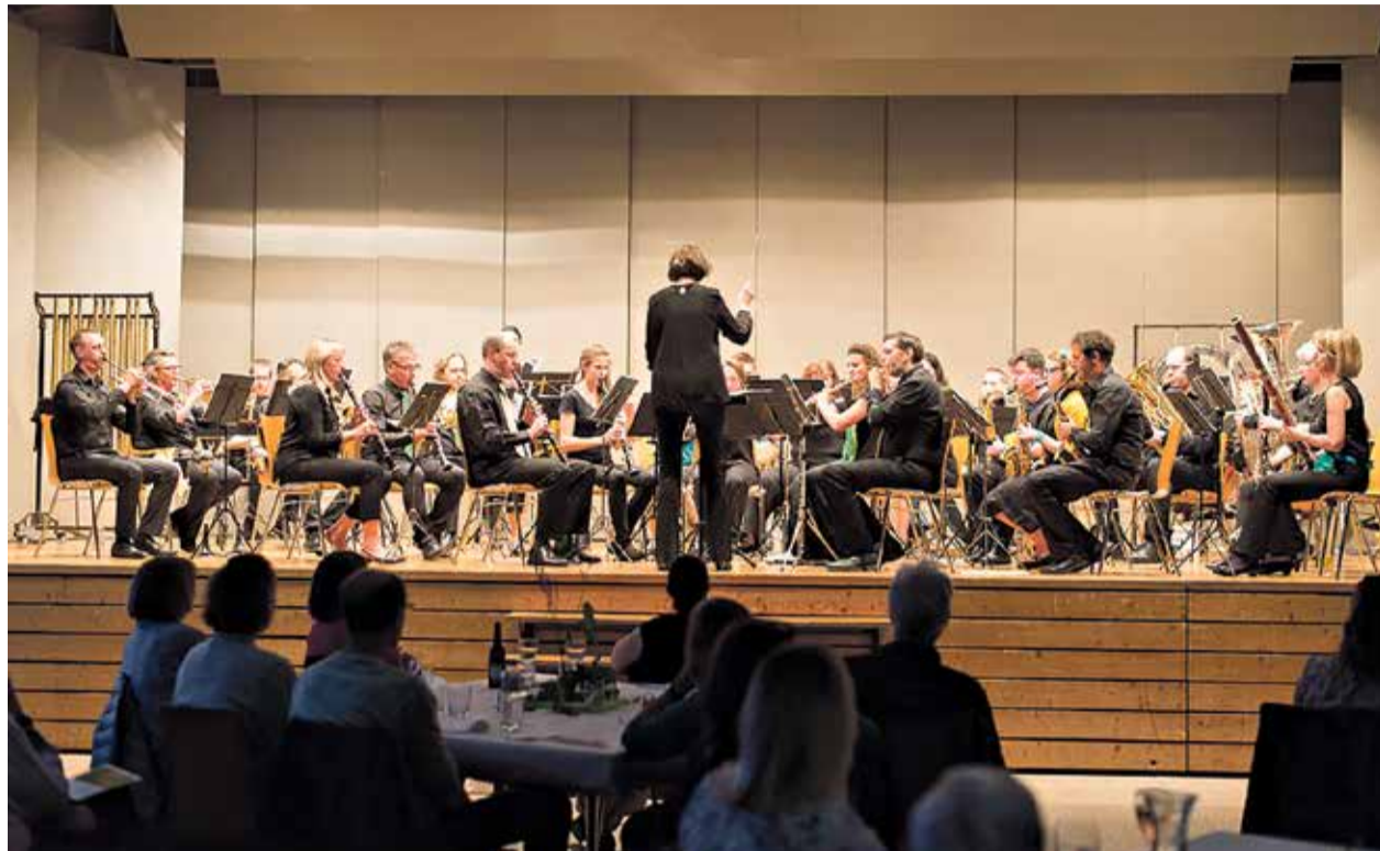
Musik und Genuss gehörten zusammen; der Musikverein Worb beim «Chrüterkonzert» 2018.

Worb ist wieder ein Verein ärmer, an der Hauptversammlung des Musikvereins Worb wurde der Beschluss gefasst, den Verein aufzulösen. Der Grund: Es konnten nicht mehr genügend Mitglieder gewonnen werden. Das Vereinsvermögen soll künftig musikalischen Initiativen in der Gemeinde Worb zufließen.