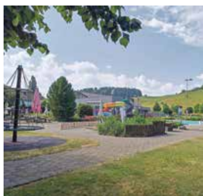
Im Wisle Beizli könnte ein neues kulinarisches Highlight in Worb entstehen.

Seit dem 11. Mai 2026 zeigt sich das Restaurant im Wislepark in neuem Glanz. Besucherinnen und Besucher können sich künftig auf kulinarische Specials freuen. Auch die anstehenden Sanierungen von Kunsteisbahn und Schwimmbad nehmen Form an.