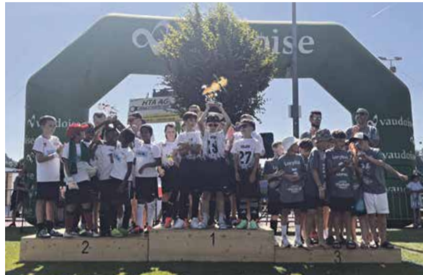
Siegerehrung beim letztjährigen Turnier.