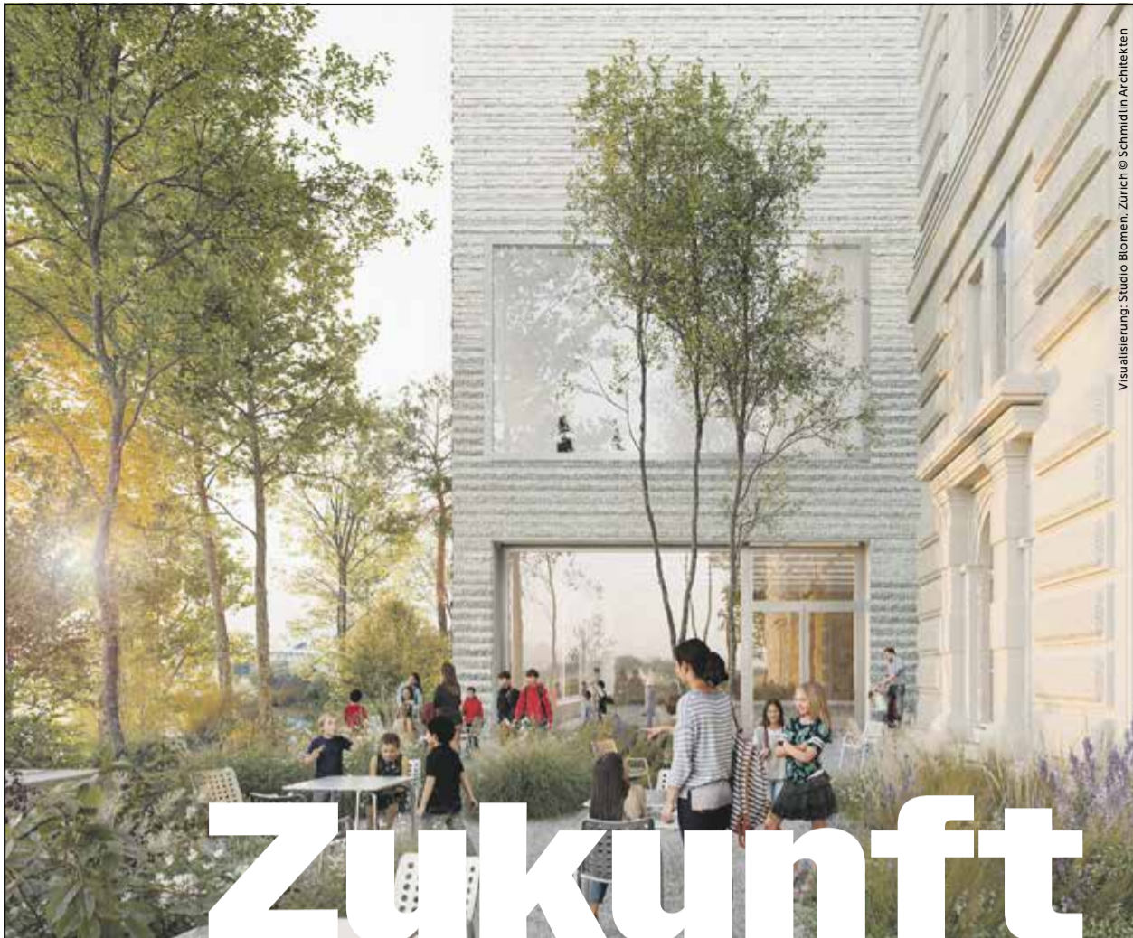
Visualisierung: Studio Blumen, Zürich © Schmidlin Architekten