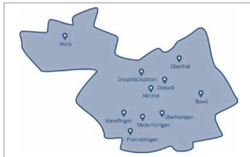
Die Region Chisetal und Worb umfasst zehn Gemeinden.

Das mybuxi macht Unternehmen und Organisationen in Worb für ihre Mitarbeitenden und Kundinnen einfach erreichbar, auch wenn sie nicht Auto fahren oder keine ÖV-Haltestelle in der Nähe haben. Alle Organisationen