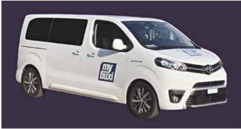
Die Pilotphase startet Anfang 2027.

Die Gemeinden des Chisetals und Worb haben sich entschieden, «Fahrt auf Verlangen» mit mybuxi als Pilot auszuprobieren. Der Kanton Bern unterstützt das Angebot. Wenn es gut angenommen wird, kann es dauerhaft eingeführt werden. Nun startet das Einführungsprojekt, Betriebsstart wird Anfang 2027 sein.