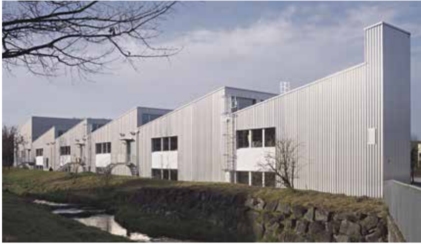
Am 6. Juni 2026 können die neuen Werkhallen besichtigt werden.

Wo gehobelt, geschweisst und gebaut wird, entstehen normalerweise Werkstücke. In den neuen Werkhallen von Terra Vecchia in Worb entstand in den vergangenen Monaten jedoch noch etwas anderes: ein gemeinsamer Ort für Handwerk, Ausbildung und neue Perspektiven.