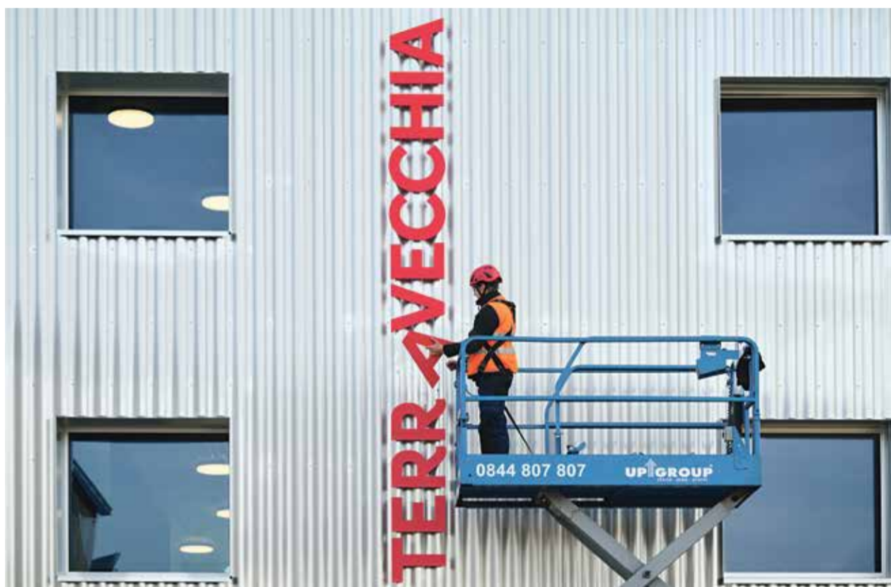
In den Werkhallen der Stiftung Terra Vecchia entstehen Zukunftsperspektiven.