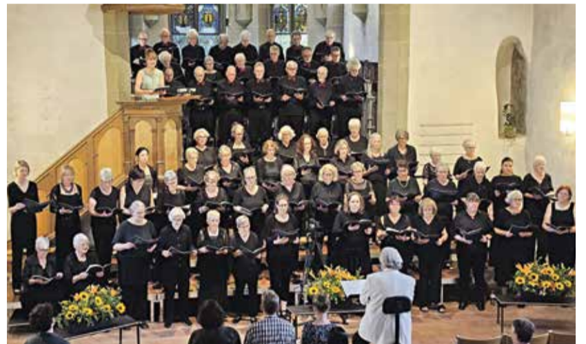
Cantica Nova Worb und der Oratorienchor Olten am Konzert 2025 in der reformierten Kirche Worb.

Am 6. und 7. Juni 2026 können sich Liebhaberinnen barocker Musik auf ein besonderes Hörerlebnis freuen. Cantica Nova Worb und der Oratorienchor Olten werden in der Reformierten Kirche Worb Stücke von Georg Friedrich Händel und Antonio Vivaldi aufführen.