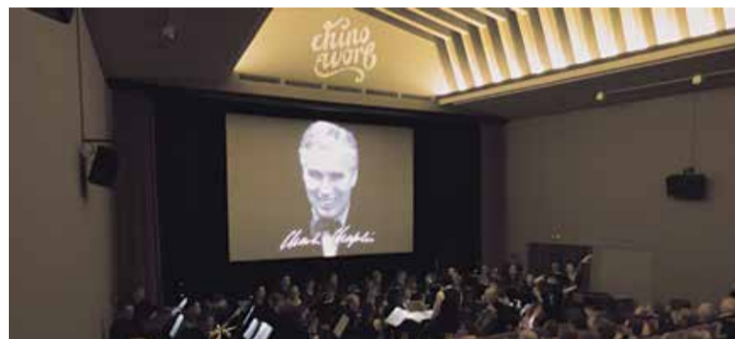
Der Musikverein hat viele kreative Projekte durchgeführt, darunter die Live-Orchestrierung von Charlie Chaplin Filmen im chinoworb.

«variazioni» kann der Musikverein Worb auf viele besondere Konzerterlebnisse zurückblicken. Damit die Idee des Vereins weiterlebt, soll das Vereinsvermögen künftig neue musikalische Initiativen in der Gemeinde Worb unterstützen. Auch Instrumente werden weitergegeben. Seite 3 AW