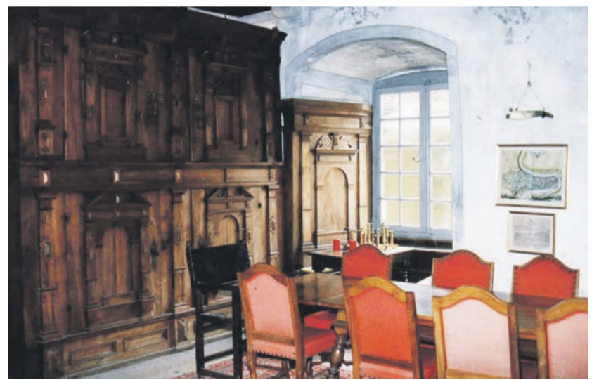
Gerichtsstube im Schloss vor 1800.