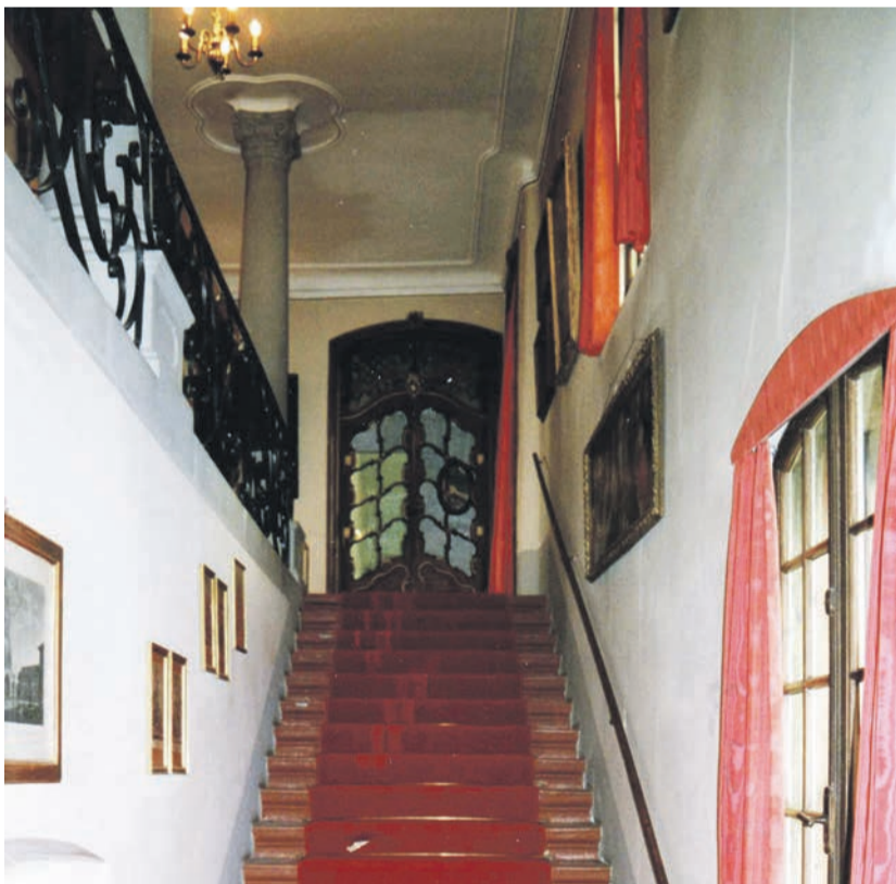
Treppenaufgang im Barockteil des Schlosses.

Am Samstag, 31. August 2013, ab 10 Uhr, führt uns Frau Seelhofer durch ihr Schloss. Anschliessend an die Führung findet auf Einladung der IG Worber Geschichte ein Apero im Schlosshof statt. Der Anlass ist öffentlich und findet bei jedem Wetter statt. Die Anmeldung ist obligatorisch – bitte an lerch.hirsig@sunrise.ch .