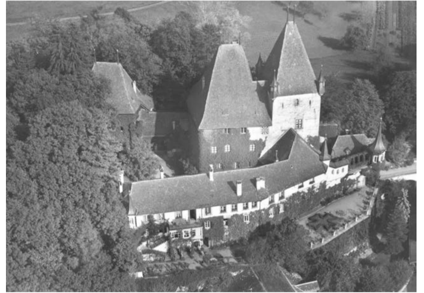
Luftansicht des Schlosses 1950.